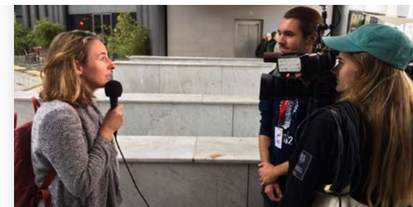
Journal vidéo diffusé sur nos réseaux et sur notre site