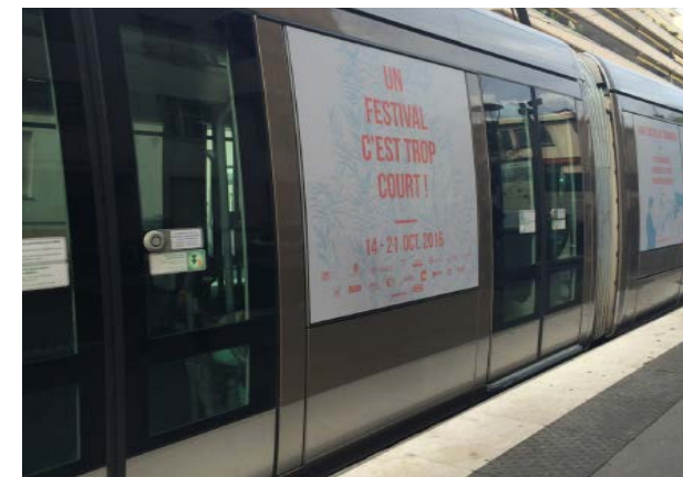
Habillage 2 lignes de Tramways à Nice : 100 000 personnes/jour