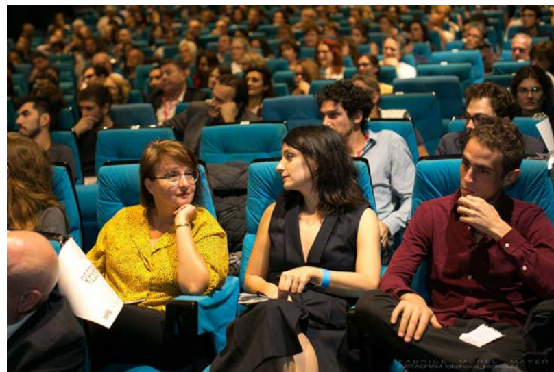
Un Festival C'est Trop Court! en 2019 : 8 jours, 7 lieux, 54 séances, 140 films pendant, 4 compétitions (Européenne, Expérience, Courts d'Ici, Animation)

Le Festival Européen du Court Métrage de Nice, Un Festival C'est Trop Court! en 2019 c'était : 140 courts métrages présentés sur 8 jours, 54 séances, 7 lieux emblématiques à Nice, 4 compétitions, 27 pays représentés.