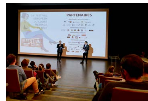
Soirée de clôture : remise de prix à la Villa Arson