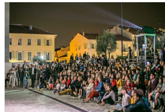
Soirée d'ouverture en 2018 au Musée d'art moderne et d'art contemporain de Nice (MAMAC) : 2 000 personnes