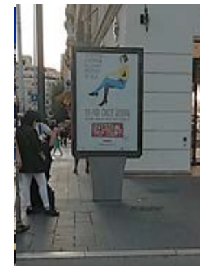
Affichage réseau JC Decaux et colonnes Morris : 100 faces à Nice