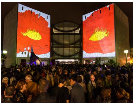
UFCTC 2017 : soirée d'ouverture sur le parvis du Musée d'art moderne et d'art contemporain de Nice (MAMAC). Projection grand format en collaboration avec l'artiste niçois Julien Ribot et de ses musiciens. 4 000 personnes ont participé.